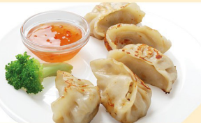
Gyoza ACF (Huhn) 5 Stk. € 5,90