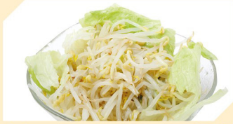
Sojasprossen Salat € 3,50