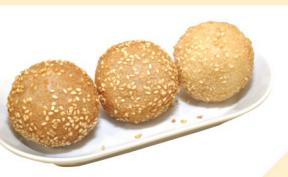
Sesambällchen gebacken N 3 Stk. € 4,50