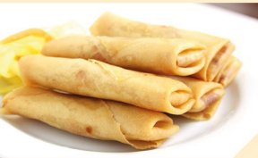
Frühlingsrollen ACFN 6 Stk. € 3,90 9 Stk. € 4,90