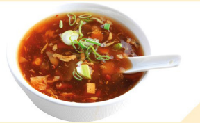
Pikant-säuerliche Suppe CF € 3,50