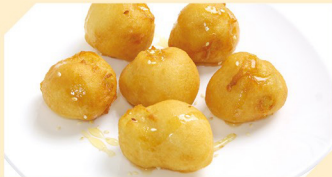
Geb. Bananen AN 6 Stk. € 4,50