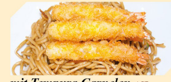
mit Tempura Garnelen ACB 4 Stk. € 7,90 5 Stk. € 8,90

Sauce Extra Verpackung je € 0,50 Knochenblausauce F , Chili Sauce, Süßsauer Sauce, Teriyaki Sauce F , Süßchili Sauce, Soja Sauce F