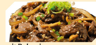
mit Bulgogi ACFN klein € 7,90 groß € 8,90