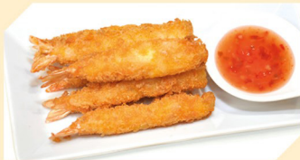
Tempura Garnelen B 6 Stk. € 6,90