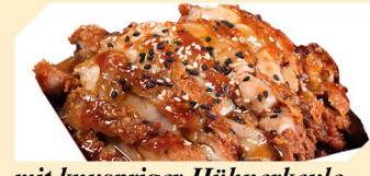
mit knuspriger Hühnerkeule ACF klein € 7,50 groß € 8,50