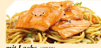
mit Lachs ACDFN klein € 7,90 groß € 8,90