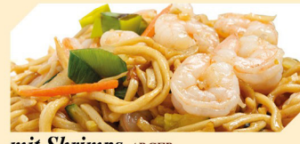
mit Shrimps ABCFR klein € 7,90 groß € 8,90