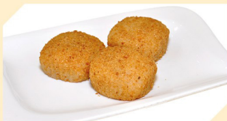
Mochi E 3 Stk. € 4,50