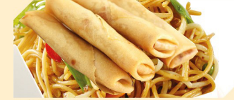
mit Frühlingsrollen ACF klein € 5,90 groß € 6,90