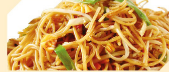
mit Gemüse ACF klein € 4,90 groß € 5,90