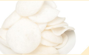
Hummer Chips B € 2,90