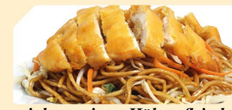
mit knusprigem Hühnerfleisch ACF klein € 6,90 groß € 7,90