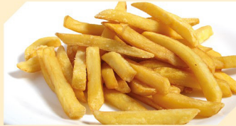
Pommes € 3,90