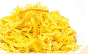
Pikanter Salat € 3,50