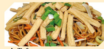
mit Tofu ACFR klein € 6,90 groß € 7,90