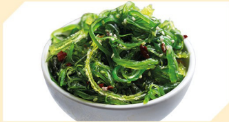
Seetang Salat N € 4,50