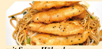
mit Sesam Hühnchen ACFN klein € 6,90 groß € 7,90